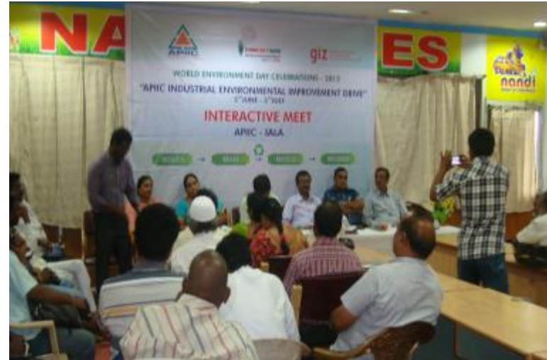
IP Rammaneyapeta, Kakinada