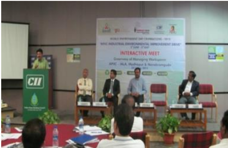
IP and AN Karimnagar